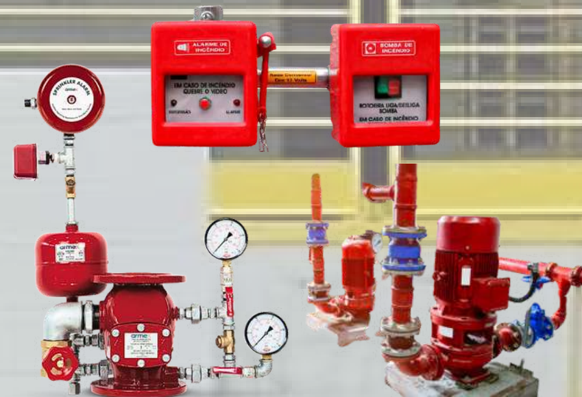
TESTES EM BOMBA DE INCÊNDIO