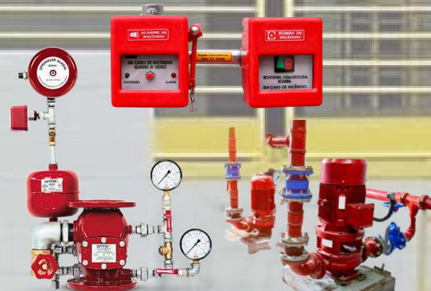
TESTES EM BOMBA DE INCÊNDIO