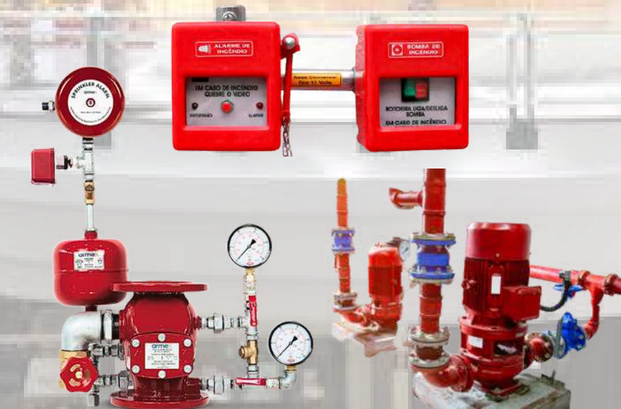
TESTES EM BOMBA DE INCÊNDIO

USO CORRETO DE TIPO DE EXTINTOR PARA CADA SITUAÇÃO