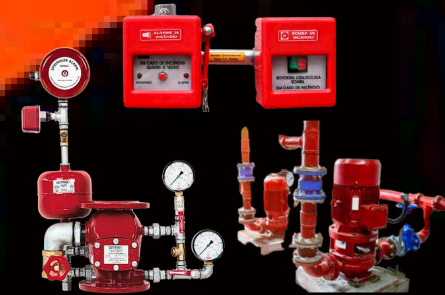
TESTES EM BOMBA DE INCÊNDIO